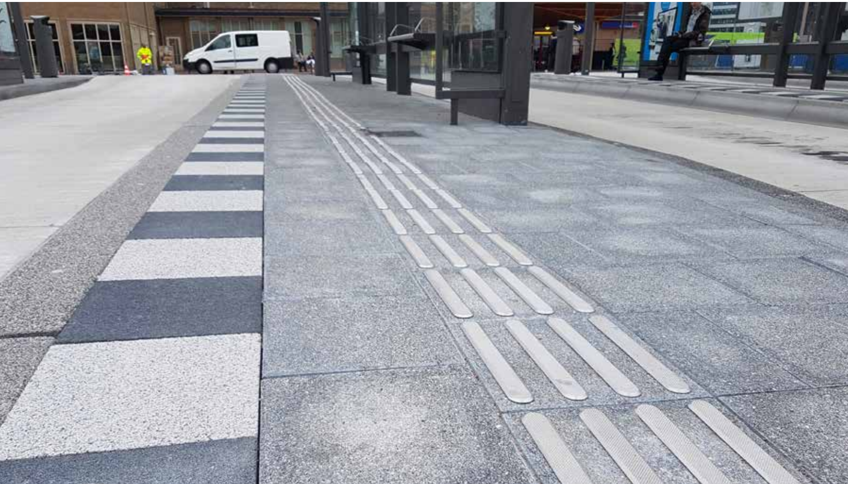
Busstation van het Amstelstation.